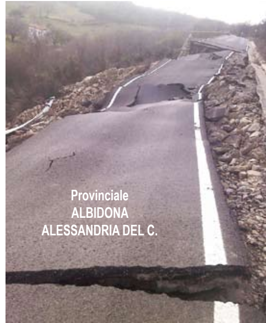
Provinciale ALBIDONA ALESSANDRIA DEL C.

Il maltempo che ha imperversato per 5 lunghi giorni ha messo ancora una volta a nudo la fragilità idrogeologica di tutto l'Alto Jonio procurando danni enormi soprattutto nelle aree interne e peggiorando il cronico dissesto idrogeologico maturato nel tempo e frutto, purtroppo, di politiche inadeguate e di corto respiro. I danni più gravi, come si diceva, si sono registrati nelle aree interne dove la pioggia ha imperversato seminando distruzione e paura, ma i comuni più colpiti sono stati Oriolo dove la gente è tornata a vivere le paure del lontano 1972 allorché un vasto movimento franoso interessò anche il vecchio cimitero che