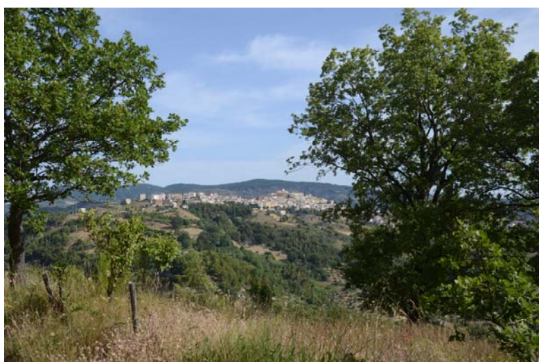
Albidona vista dalle querce di Sant'Elia

Paulo Coelho dice che in questa società del digitale non c'è bisogno di scovare libri nelle biblioteche e documenti negli archivi; basta immergersi nella rete Internet: "trovi tutto". Sì, nella cosiddetta Wikipedia trovi tutto quello che cerchi, ma leggerai anche notizie confuse, inesatte e incomplete. Tutto sommato, bisogna ritornare a Poggio Bracciolini, il grande erudito umanista del '500, che in un vecchio convento della Germania scoprì un prezioso manoscritto del romano Quintiliano. Grande merito dei nostri monaci, che salvarono tanti manoscritti della cultura greca e latina. Glie ne dava atto anche Giacomo Leopardi, quando scriveva all'amico gesuita Angelo Mai, lo scopritore della Repubblica di Cicerone: "... In un balen feconde venner le carte; alla stagion presente – i polverosi chiostrì. Serbaro occulti i generosi e santi detti degli avi...". (Giacomo Leopardi – Canti – Ad Angelo Mai ). (Giuseppe Rizzo)