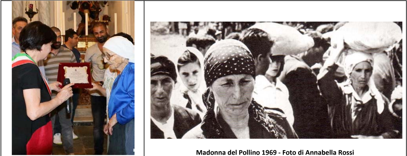
Madonna del Pollino 1969