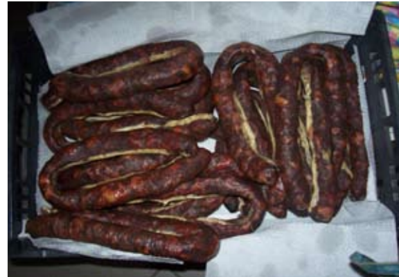
"Sazizza" albidonese

piccolo locale, in una via parallela alla sede attuale, a poche decine di metri, con una saletta e la cucina, arredamento spartano, menù essenziale con il compianto zio Vincenzo in sala e la signora Filomena in cucina, prezzi onestissimi e prodotti genuini: bucatini con pecorino, lagane e ceci, bracirole squisite, pepate e zuppe di cozze, frutti di mare carne ai ferri, patate e peperoni, funghi di stagione