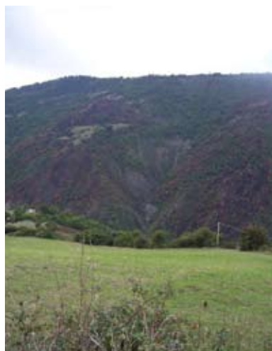
Manca di Mostarico

Non possiamo dimenticare i disastri provocati dagli incendi dello scorso anno, ma i piromani hanno cominciato già da questo mese di giugno 2018. Ora, ci sono i piromani di città e di campagna: come i topi. Ma i topi non sono dannosi come i brucia-boschi.