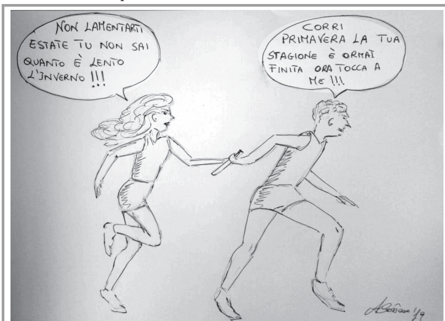
LA VIGNETTA di ALESSANDRA CORTESE