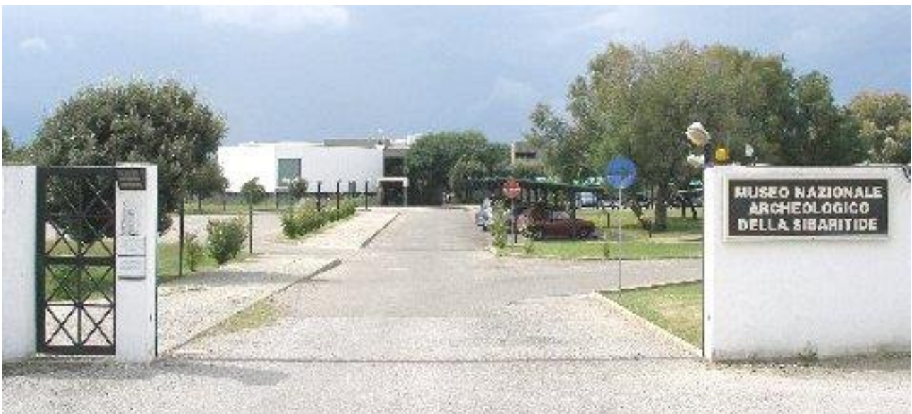
SIBARI - MUSEO DELLA SIBARITIDE