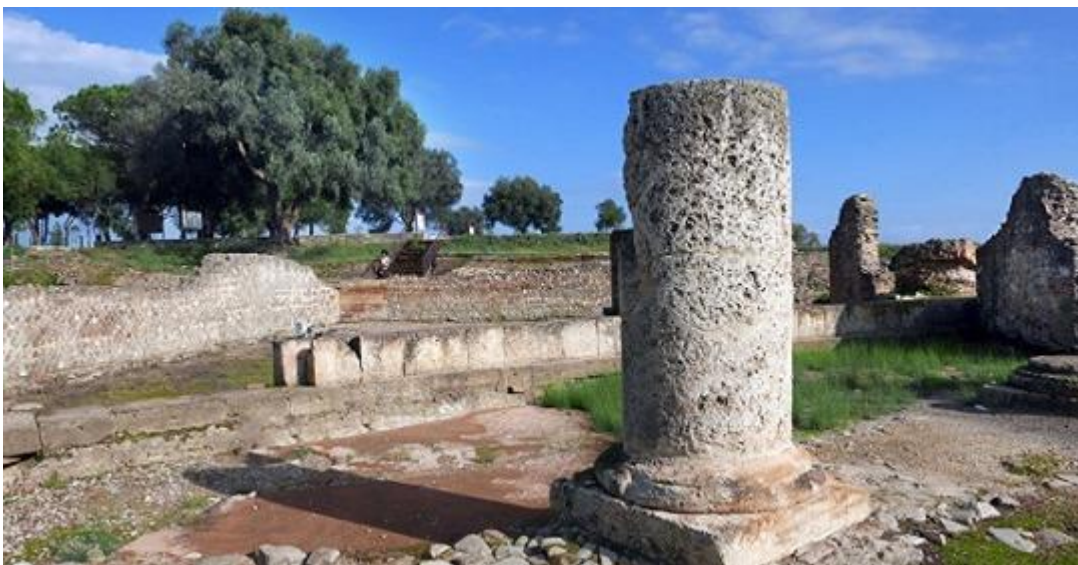
Parco Archeologico dell'Antica Sybaris