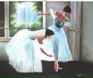
nelle foto due dipinti dell'artista: "Scilla" e "Ballerine"

miliari, frequentò l'Istituto Tecnico per Geometri "G. Filangieri" di Trebisacce, che compì con risultati positivi evitando il pendolarismo da Castrovillari. Oggi, nel suo laboratorio privato, continua a sperimentare le varie tecniche pittoriche e tutte con successo e per il momento egli stesso si considera un pittore e utilizza con diligenza gli strumenti necessari e "l'arte vera dopo verrà" afferma il giovane artista con quell'aria modesta e priva di presunzione che lo caratterizza. Non si nutre di sogni pindarici, ma segue il mondo dell'arte attraverso le riviste e partecipa alle mostre degli artisti. E' consapevole del fatto che il mondo dell'arte e del sapere in generale è infinito e occorre studiare e impegnarsi e ancora conoscere, apprendere, studiare e ancora... e ancora. La sua sana passione lo conduce sulla strada della perseveranza e della determinazione a voler raggiungere traguardi significativi. E' un verista puro, il suo tratteggio è sicuro e deciso, i risultati non tarderanno a venire. E' stupefacente il ritratto del maestro Salvatore D'Alì, per i colori, per la composizione, per l'espressione. I suoi ritratti, le sue danzatrici, di tanto in tanto è possibile apprezzarli presso la galleria "Orizzonti" su viale della Libertà.