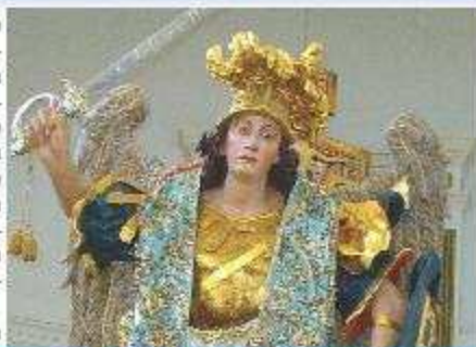
San Michele Arcangelo