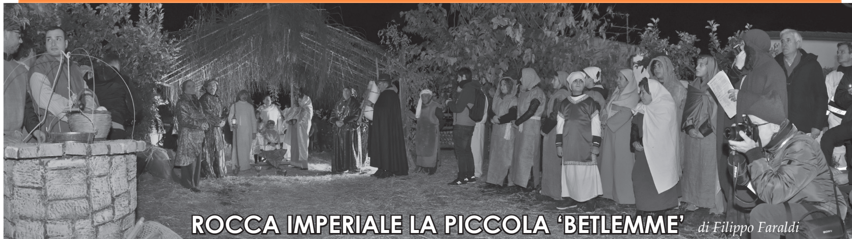
ROCCA IMPERIALE LA PICCOLA 'BETLEMME' di Filippo Faraldi