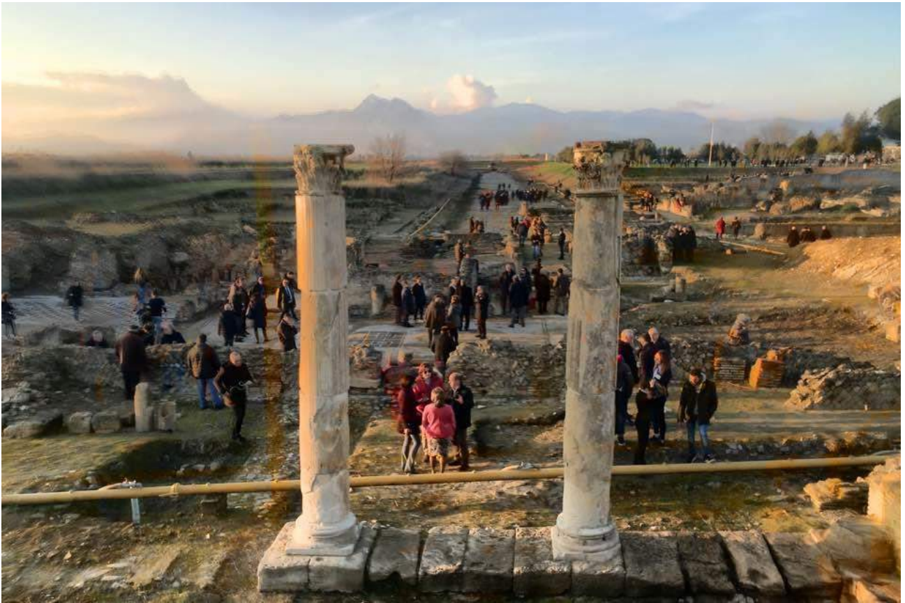
Parco Archeologico di Sibari – Visitatori a spasso nella storia