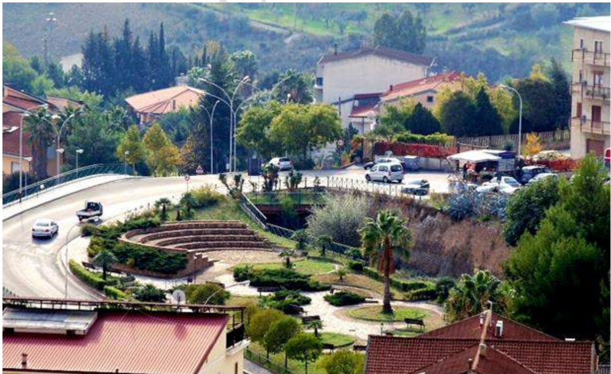
Pezzi di Città: Villetta Ponte del Treno