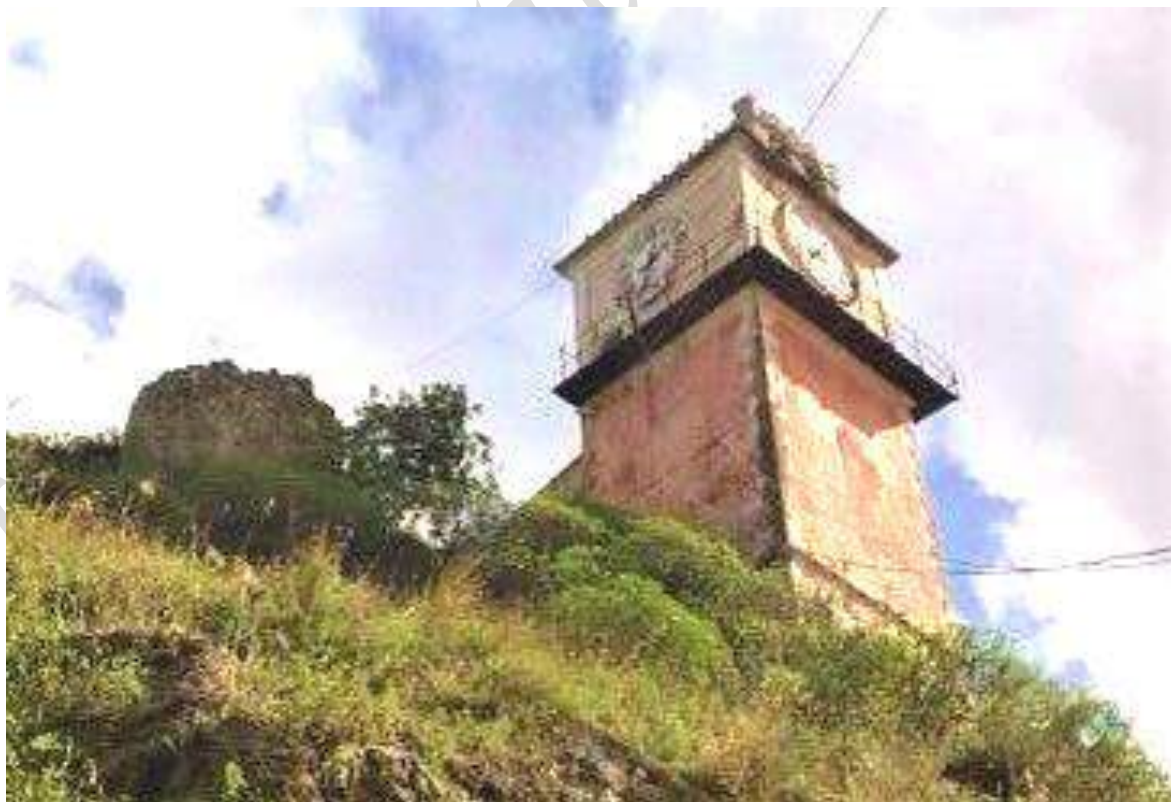
Pezzi di Città: Torre dell'Orologio Comunale