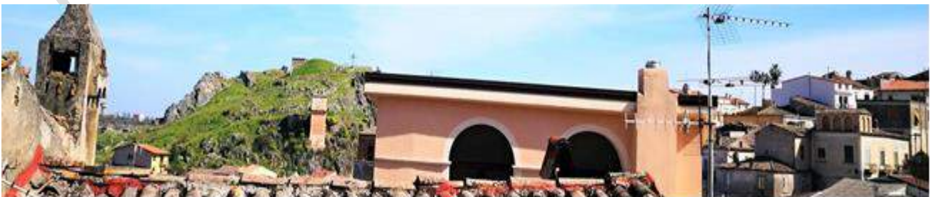
Pezzi di Città: Cassano – Centro Storico