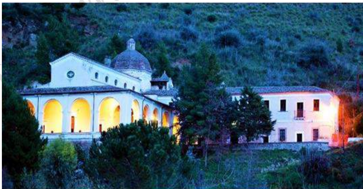
Pezzi di Città: Cassano – Santuario Madonna della Catena