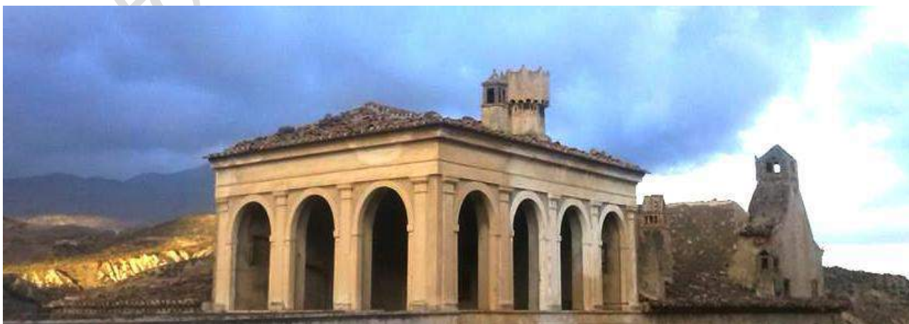
Pezzi di Città : Centro Storico