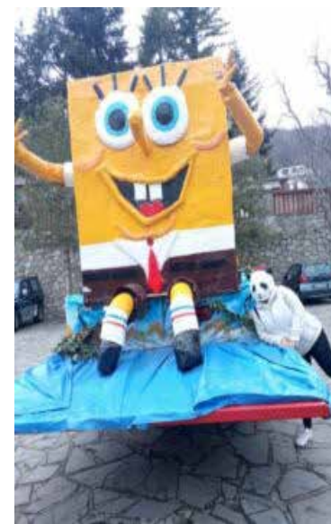
Carnevale di Plataci