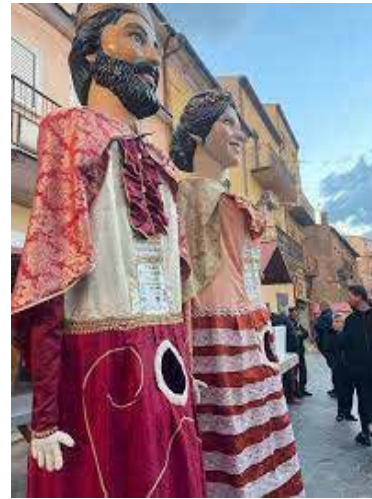
I giganti di Varapodio

PLATACI Sulla scia del leggendario Carnevale Ambrosiano che come è noto a Milano e nel suo interland inizia nella prima domenica di Quaresima e si protrae per diversi giorni, nel suggestivo borgo arboreo dell'Alto Jonio domenica 26 marzo si è svolto il tradizionale Carnevale di Plataci. L'ha organizzato, con il sostegno dell'amministrazione comunale in carica, la neonata “Pro Loco-Plataci” in sinergia con l'Associazione “Jete”, con l'Associazione dei “Giganti di Varapodio” (RC) e con l'Associazione “Antonio de Rasis”. In realtà, secondo quanto hanno riferito gli organizzatori dell'evento, Plataci ha mutuato l'impropria